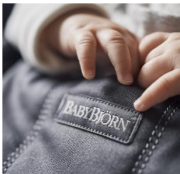
Bliss Cotton, 100% хлопок