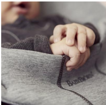
3D Jersey, хлопок/трикотаж