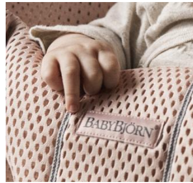
3D-сетка Bliss Mesh, 100 % полиэстер

Материалы соответствуют требованиям стандарта Оеко-Тех® 100, класс I и не содержат опасных веществ и аллергенов.