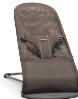
Арт. 0060.11 Цвет: кофейный Ткань: сетка