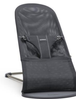
Арт. 0060.13 Цвет: антрацитовый Ткань: сетка