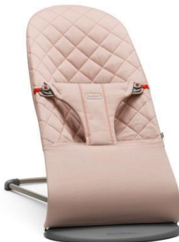
Арт. 0060.14 Цвет: розовый Ткань: хлопок