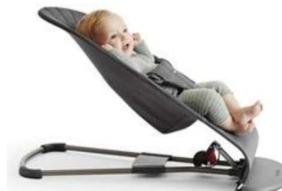
Высокое положение для игры

Маленький ребёнок во время игры может внезапно заснуть. Поэтому в кресле-шезлонге Bliss предусмотрено три положения. Вы без труда можете переместить спинку шезлонга из поднятого положения в опущенное, предназначенное для сна, не вынимая малыша из кресла.