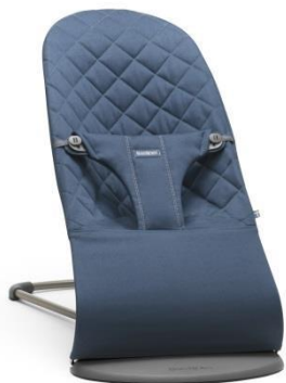
Арт. 0060.15 Цвет: синий Ткань: хлопок