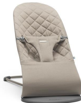
Арт. 0060.17 Цвет: песочный Ткань: хлопок