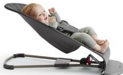
Среднее положение для отдыха