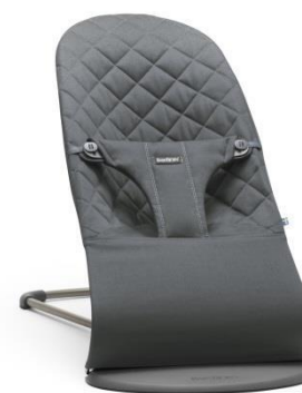
Арт. 0060.21 Цвет: антрацитовый Ткань: хлопок