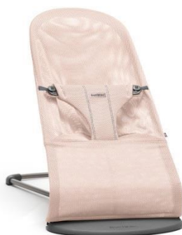
Арт. 0060.12 Цвет: нежно розовый Ткань: сетка