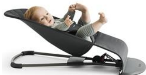
Нижнее положение для сна